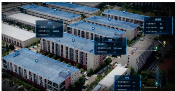
图3-4 智能微电网项目-简阳新经济产业园