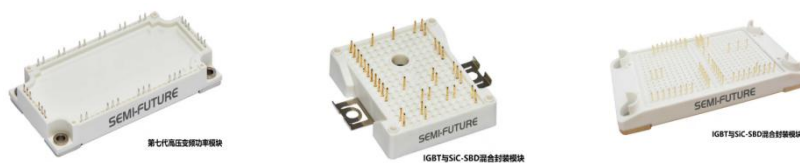
图3-8 功率半导体相关产品

报告期，森未科技推进第8代IGBT技术平台开发，同步搭建SiC器件测试研发平台，推动技术成果转化；整合研发资源和供应链能力，构建“市场导向-技术攻关-产能释放”全流程闭环管理；组建中台部门，开展市场与用户研究、产品规划、项目协同与产品生命周期管理，强化市场销售和产品研发的衔接与协同，加速产品迭代与产能释放，推动功率半导体产品从单一的IGBT产品线扩展为IGBT产品线、SiC产品线、Si MOSFET产品线，完善产品谱系，丰富功率半导体产品类型，拓展产品布局。市场拓展方面，在夯实工控等领域功率器件业务的基础上，积极拓展新能源、商厨、未来智能等应用场景。组织保障方面，构建“市场+产品+保供”铁三角营销响应机制，提升客户响应效率。质量管理方面，围绕“功率芯片设计—加工（委外）—测试到应用”的技术能力，依托自建的功率芯片应用检测中心，打造IGBT芯片和器件检测分析平台，可覆盖器件测试分析和失效分析的整套流程，持续通过CNAS年审及ISO9001质量管理体系、IATF16949汽车行业质量管理体系认证。推进供应链韧性管理，加强供应商质量管控和协同，提升产品良率。