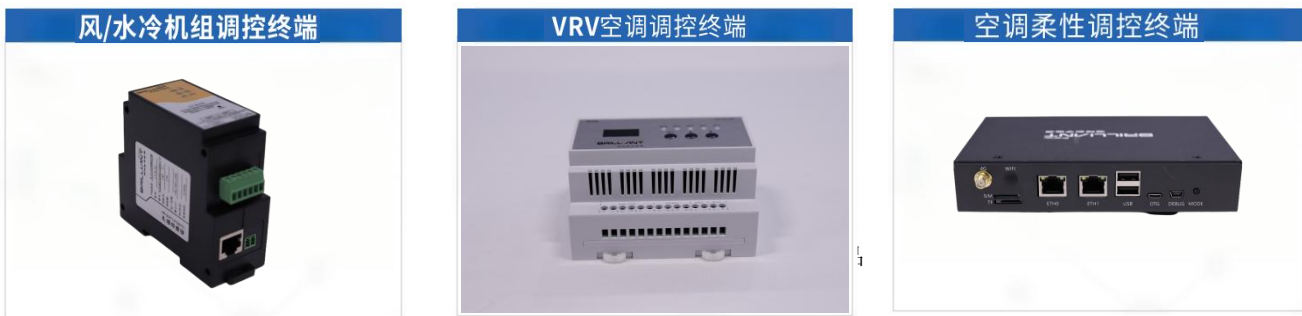
图3-2 倍特数智虚拟电厂平台终端产品

2025年，在虚拟电厂领域，倍特数能自主研发的“倍特数智虚拟电厂平台”及解决方案，已逐步从成都高新区向外拓展，全年新增落地成都东部新区、简阳市等12个区域虚拟电厂项目，已成为区域市场重要的解决方案提供商，“倍特数智虚拟电厂平台”入选《全国工业领域电力需求侧管理典型案例（2025年）》的技术平台，为市场拓展储备技术动能；在储能系统集成领域，拓展工商业储能业务，参与建设四川时代60MW/120MWh工商业储能项目，并在电网侧储能领域实现市场拓展，在成都、简阳等区域市场打造多个标杆项目，形成了良好的示范效应，为后续储能市场拓展奠定基础。