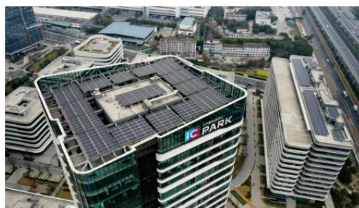
图3-5 智能微电网项目-IC设计产业园