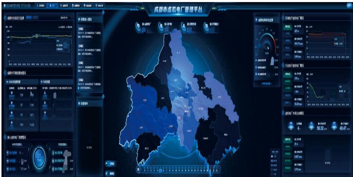
图 3-3 成都市虚拟电厂项目

2025年，在虚拟电厂领域，倍特数能自主研发的“倍特数智虚拟电厂平台”及解决方案，已逐步从成都高新区向外拓展，全年新增落地成都东部新区、简阳市等12个区域虚拟电厂项目，已成为区域市场重要的解决方案提供商，“倍特数智虚拟电厂平台”入选《全国工业领域电力需求侧管理典型案例（2025年）》的技术平台，为市场拓展储备技术动能；在储能系统集成领域，拓展工商业储能业务，参与建设四川时代60MW/120MWh工商业储能项目，并在电网侧储能领域实现市场拓展，在成都、简阳等区域市场打造多个标杆项目，形成了良好的示范效应，为后续储能市场拓展奠定基础。