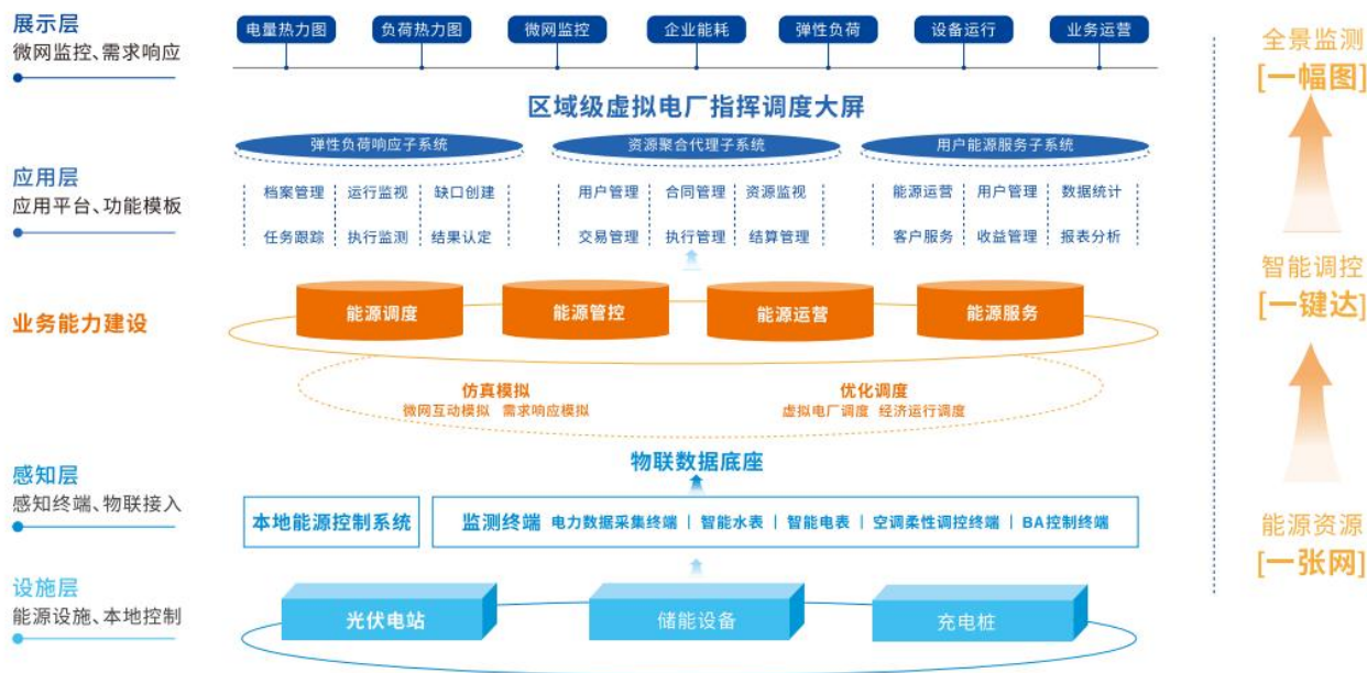
图3-1 倍特数智虚拟电厂平台模式