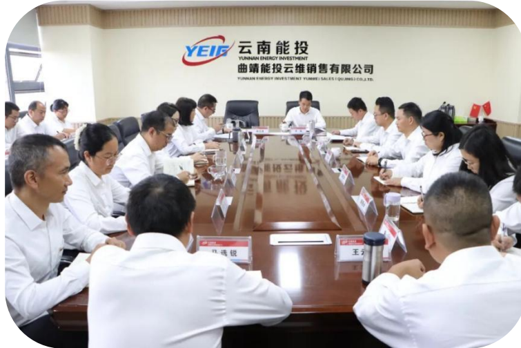
图：公司党委书记、董事长到子公司调研