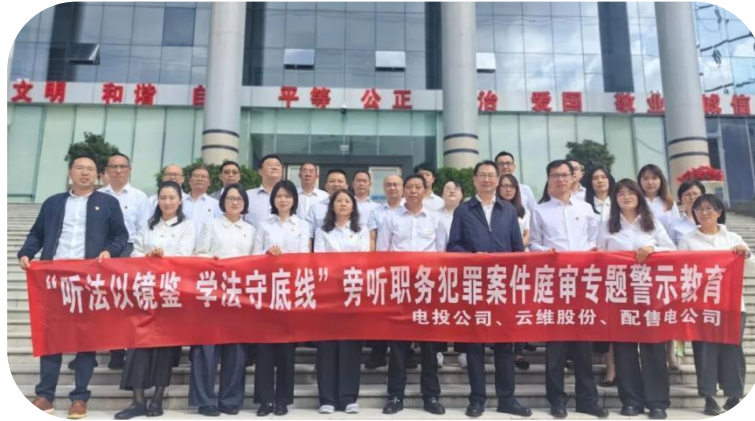
图：法院庭审旁听“沉浸式”警示教育活动