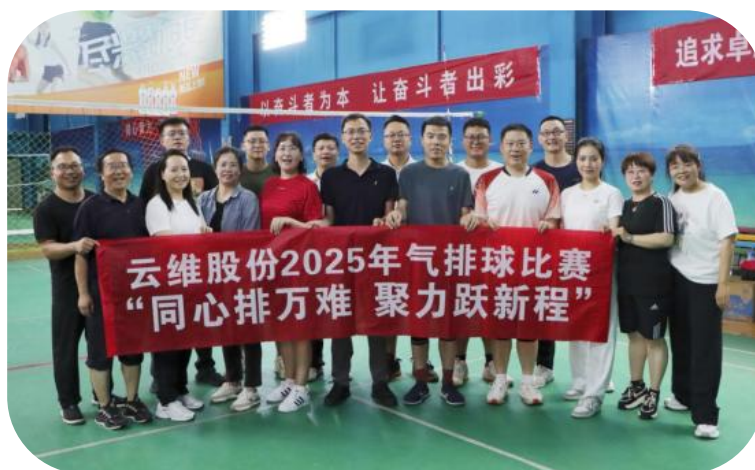
图：职工气排球比赛活动

公司充分发挥工会纽带作用，开展了元旦春节送温暖、春秋游、爬山、气排球及羽毛球比赛等丰富多彩的文体活动，参与人次覆盖全员。