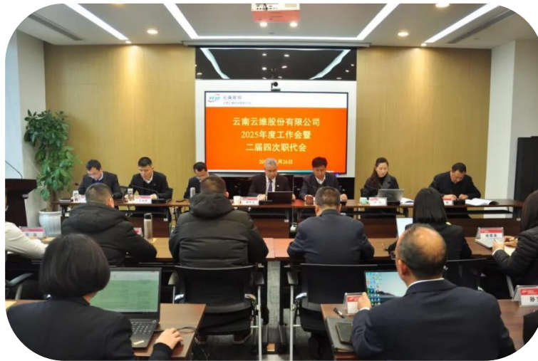
图：公司召开职代会

公司始终坚持以职工代表大会为基本形式，2025年召开职工代表大会1次，审议通过了《公司员工关系及考核管理办法》等涉及员工切身利益的重大事项，确保决策过程公开透明；同时常态化畅通职工诉求表达渠道，用心用情支持工会维权，真正实现了企业发展依靠员工、成果由员工共享。