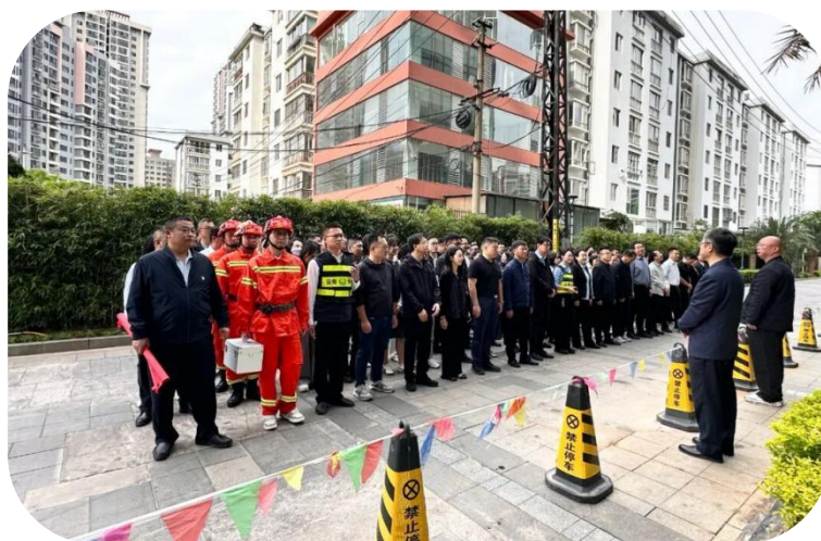
图：地震避险应急演练