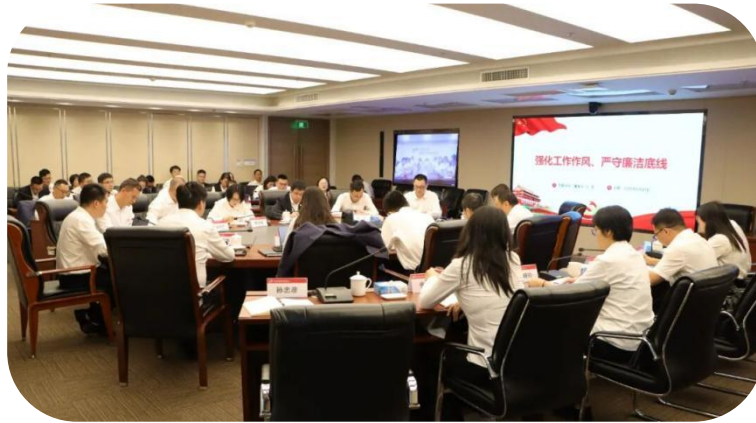
图：党支部主题党日活动