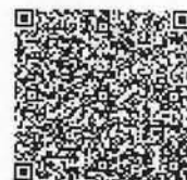
张子周年检二维码

发证日期: 2007 年 12 月 1 日 Date of Issuance y /m /d