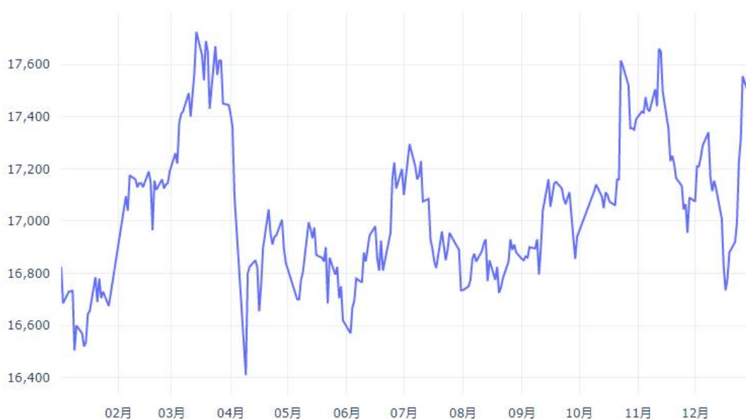
2025年SHFE铅期货价格趋势

铜：铜价在 2025 年呈现强劲上涨趋势，主力期货合约价格从年初的 73,833 元/吨上涨至年末的 88,217 元/吨，涨幅达 19.5%，成为工业金属中表现最强劲的品种。基本面方面，供应端全球铜矿开采量增速放缓，供给增长有限，同时美国将铜纳入关键矿物名单引发贸易流扭曲，大量铜为规避关税风险提前流入美国，导致COMEX铜库存突破 40 万吨高位。需求端则受益于新能源车单车用铜量增至 83 千克（传统车 30 千克）、光伏装机用铜 5000t/GW，以及AI数据中心等新兴领域需求快速增长。根据国际铜研究组织（ICSG）预测，2025 年全球精炼铜市场预计小幅过剩 17.8 万吨，但市场预期 2026 年可能转为短缺 15 万吨，这种供需格局的预期变化为铜价上涨提供了基本面支撑。