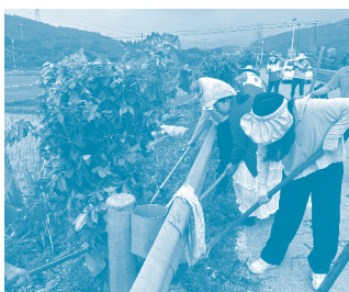
我們參與西湖村的志願植樹活動。

作為一間重視社會責任之公司，本集團致力了解我們營運所在社區之需求。本集團致力與持份者發展長期關係，並竭力為推動社區發展的項目作出貢獻。通過鼓勵參與社區服務及透過捐款及慈善活動支持有需要的人士，本集團繼續致力於培養員工強烈的社會責任感。我們致力於通過增強對災害救援工作的支持，對社會(特別是在危機時刻)產生重要影響。