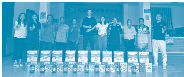
於中秋節期間，我們在西湖村組織社區拓展活動，以支援弱勢家庭。

於報告期間，本集團注意到香港社區出現意外事件，對部分居民的日常生活造成直接干擾。為表明我們對社區福祉的承擔，本集團透過適當及可靠的渠道，一次性提供慈善捐贈，以支持受影響社區的實際需要。該支援行動並非為宣傳而推行。本集團尊重受影響人士的私隱權，因此並無就此對外宣傳或披露。