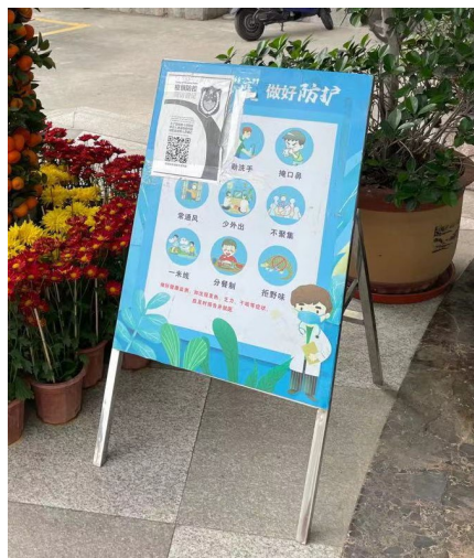
在中亞烯谷深圳辦公室推廣個人衛生防護的告示牌