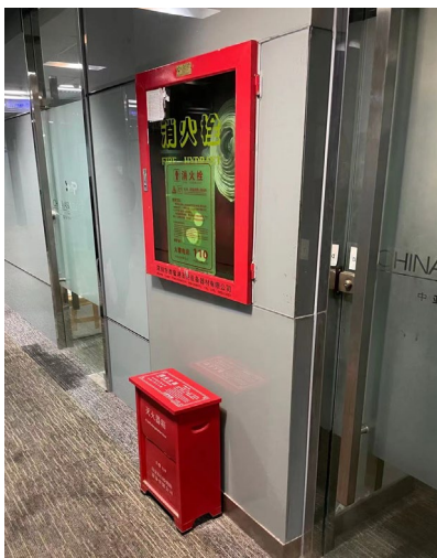
在中亞烯谷深圳辦公室安裝的消防設備

另一方面，相關的經理及監事參加政府部門或其他組織舉辦的職業安全及健康研討會，以獲得最新安全法定要求及有關安全與健康管理、風險評估及工業安全方面的新知識。透過「訓練培訓師」的實踐，管理層每年舉行四次安全分享課程，以分享有關安全管理的見解及知識，以及與僱員交流經驗，以降低僱員於日常工作中的安全風險及增加其安全意識。