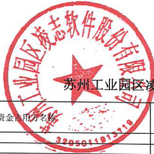
苏州工业园区凌志软件股份有限公司2025年度非经营性资金占用及其他关联资金往来情况汇总表