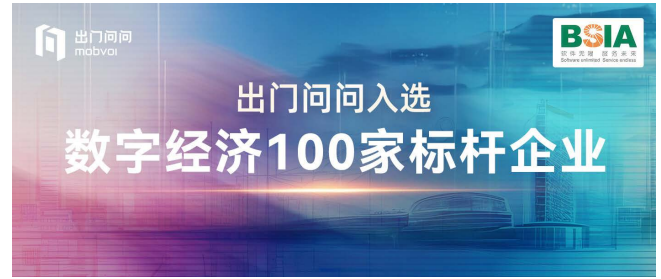
北京市數字經濟100家標杆企業 (北京軟件和信息服務業協會)