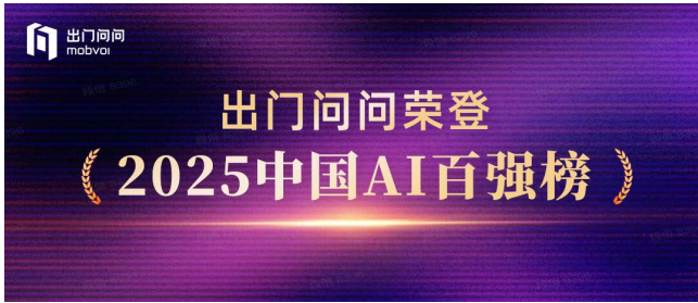
2025中國AI百強榜 (非凡產研)