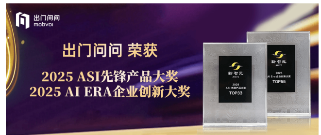
2025 AI Era企業創新大獎TOP 55 (新智元) 2025 ASI先鋒產品大獎TOP 33 (新智元)