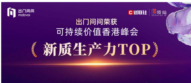
「新質生產力TOP」 (財聯社)