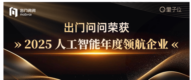
2025人工智能年度領航企業 (量子位)