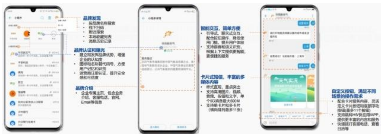
梦网 5G 消息（RCS）实际应用案例展示

5G 消息（RCS）是基于 GSMA RCS UP 标准构建，实现消息的多媒体化、轻量化，通过引入 Maap 技术实现行业消息的交互化。通过 5G 消息将带给人们全新的交互体验，用户在消息窗口内就能完成服务搜索、发现、交互、支付等一站式的业务体验，构建了适配 5G 时代的全新信息服务入口。