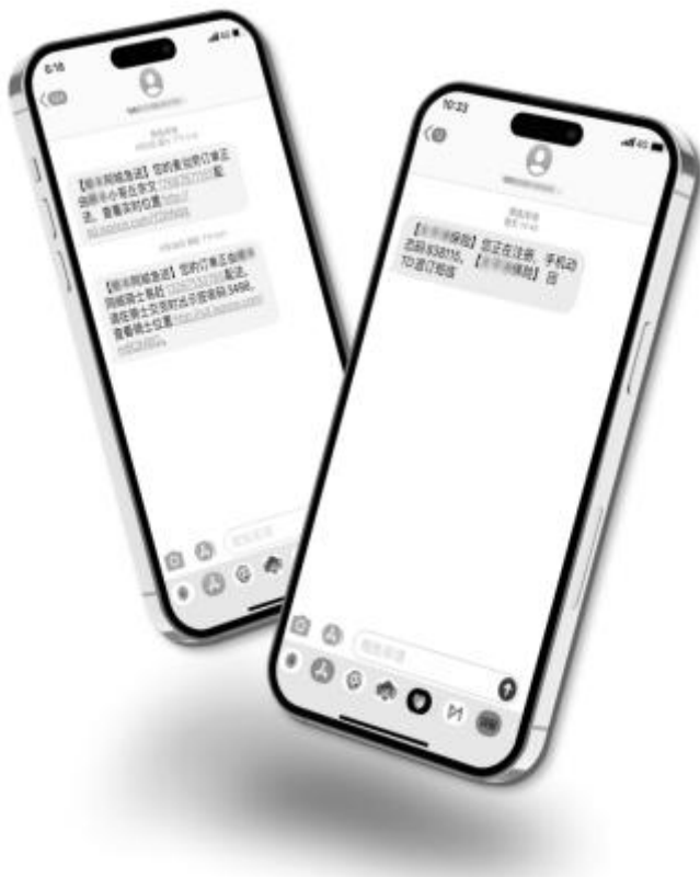
行业短信用户界面截图