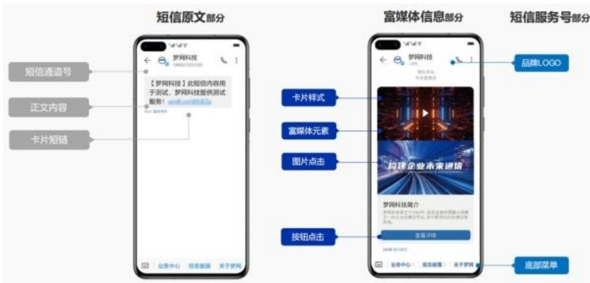
5G 阅信消息产品展示

5G 阅信通过手机终端短信智能解析增强技术，将传统文本短信无缝升级为具备交互能力的多媒体智能信息，其支持视频、高清图片、文字等多种媒体元素展示，并具备浏览器内置访问、LBS、APP、快应用、小程序等多种应用交互能力。通过融合多媒体内容与深度交互能力，打造集信息展示、场景服务、商业转化于一体的新型通信载体，赋能企业与用户实现应用交互、内容访问、信息查询、智能客服等实时互动。同时，5G 阅信支持个性化推送，能够针对不同人群，实现千人千面，千人千迹的展示，让产品或服务精准触达服务对象。