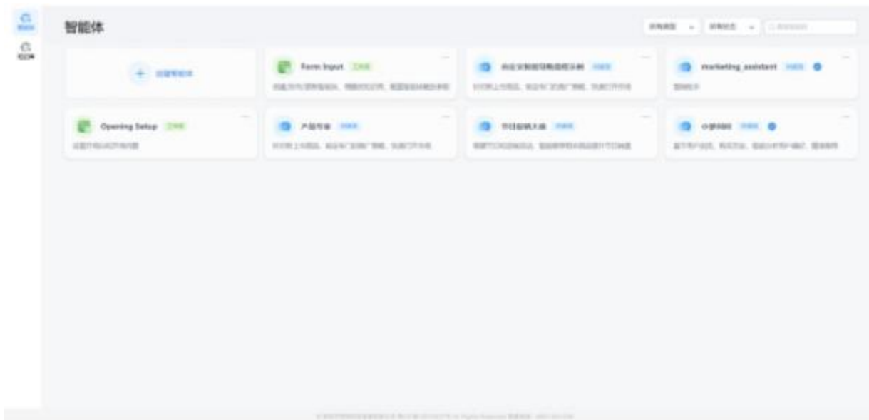
天慧智汇台用户界面截图

平台通过“1+N+X”大模型产品体系，为用户提供多元服务。“1”是智能体交互接口（API&GUI）平台，基于通用大模型灵活调度，实现个性化智能场景快速交付。“N”涵盖语言、语音、医疗等多领域专用大模型，满足不同行业专业需求。“X”代表众多原生场景，深度融合政务、金融、医疗等多行业，如医疗辅助诊断、智慧政务助手等应用，助力行业智能化升级。其凭借技术融合能力，在多行业实现深度赋能，推动企业从“信息触达”迈向“价值创造”。