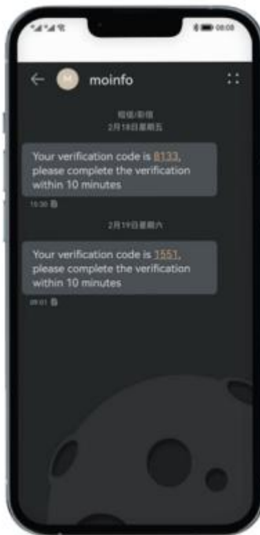
国际云短信用户界面截图

梦网国际云短信是面向出海型企业客户，通过直连梦网专业打造的国际短信网关，提供为境外手机号顾客发送验证码、服务通知、营销推广的全球化通信服务。梦网科技具备一点接入、全球送达的短信到达能力，在香港，印度尼西亚等地区/国家享有独家网络通达优势，提供专业高效的跨语种、跨时区、跨运营商的全球化支撑和业务质量保障服务。