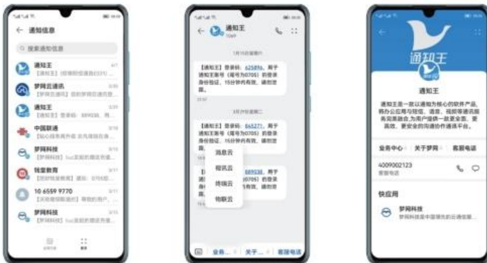
短信服务号用户界面截图