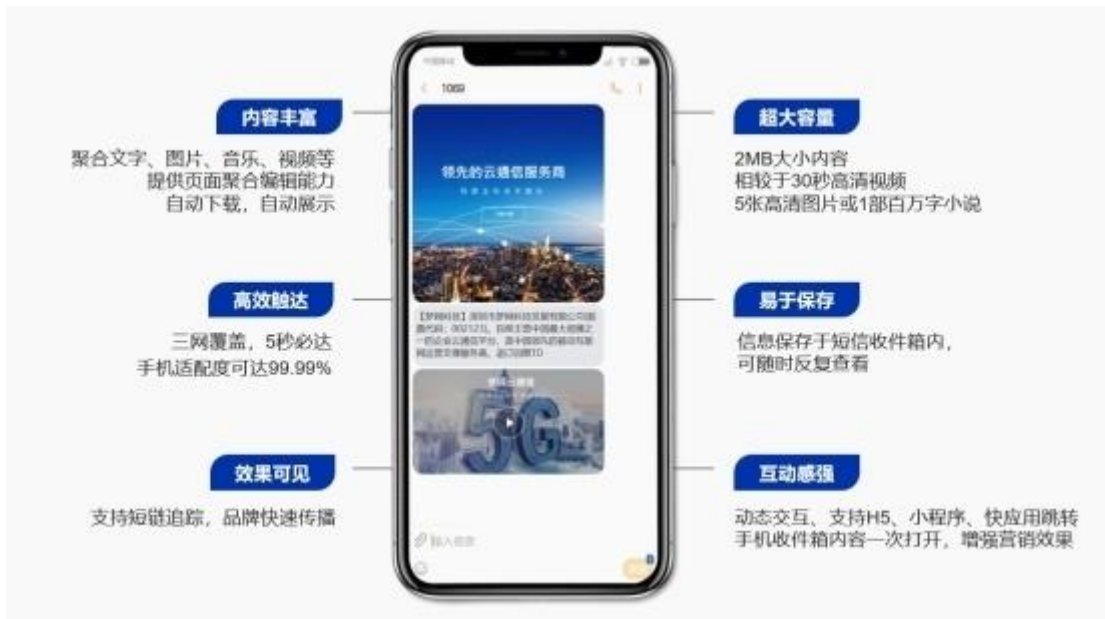
视信用户界面截图

片等富媒体信息。视信为用户呈现丰富、直观、多元化的视觉展示效果，是移动新媒体技术发展下企业数字化转型、场景化赋能、短视频营销的新兴通讯和传播工具。