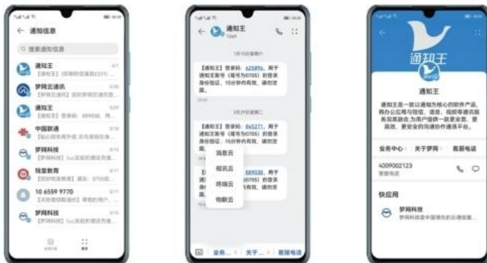
短信服务号用户界面截图