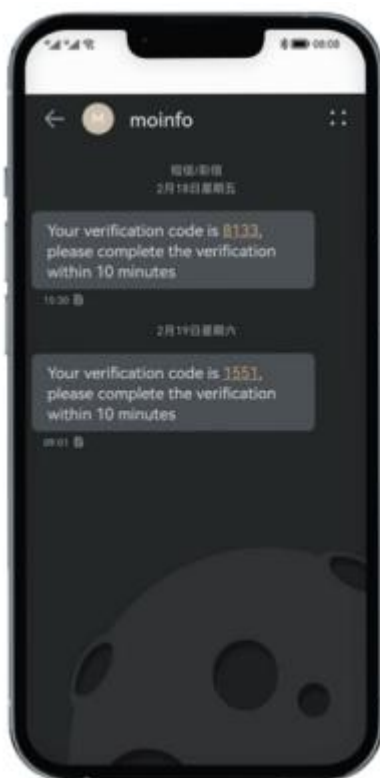
国际云短信用户界面截图

梦网国际云短信是面向出海型企业客户，通过直连梦网专业打造的国际短信网关，提供为境外手机号顾客发送验证码、服务通知、营销推广的全球化通信服务。梦网科技具备一点接入、全球送达的短信到达能力，在香港，印度尼西亚等地区/国家享有独家网络通达优势，提供专业高效的跨语种、跨时区、跨运营商的全球化支撑和业务质量保障服务。