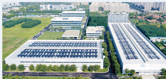
英科医疗智能医疗器械研发营销科技园