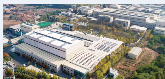
山东青州生产基地