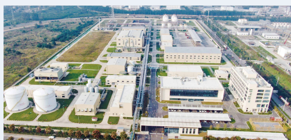
安徽凯泽新材料有限公司