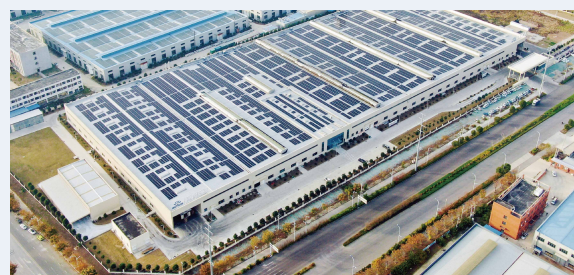
安徽国毅模具科技有限公司