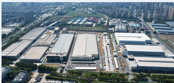
江苏镇江生产基地