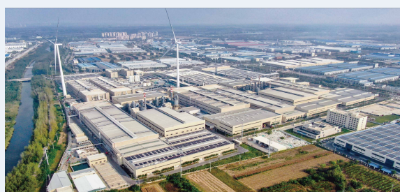
安徽淮北生产基地

从行业现状看，高额的投资成本和较长的建设周期对新进入者构成资本壁垒，需要长期的高额投资才能产生收益，这使得公司在未来的竞争中能够长期处于优势地位。