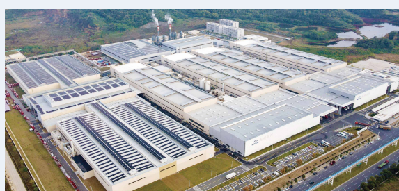
江西九江生产基地