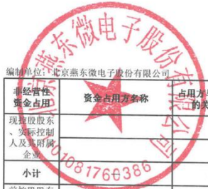
2025年度非经营性资金占用及其他关联资金往来情况汇总表