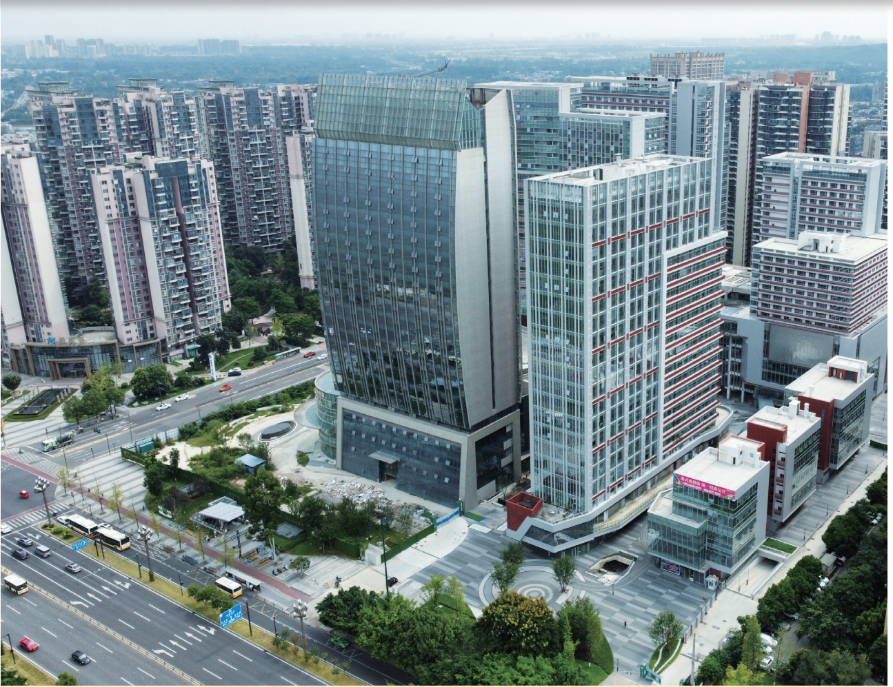
富豪國際新都薈 — 酒店及商業/寫字樓大樓