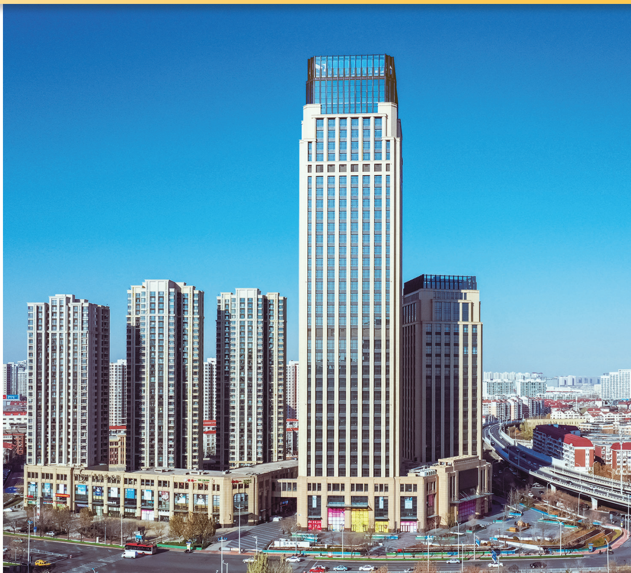
富豪新開門 — 位於天津河東區黃金地段之商業/寫字樓/住宅綜合發展項目