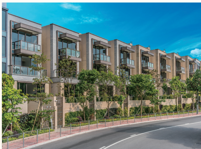
富豪 • 悅庭內花園洋房之外觀