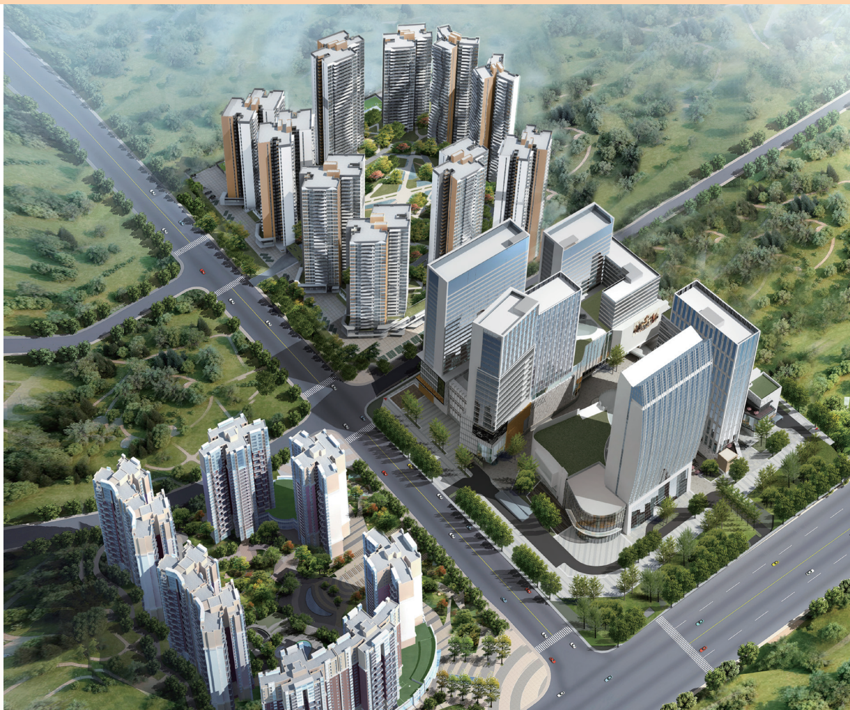
富豪國際新都薈 — 位於四川成都新都區之住宅/商業/寫字樓/酒店綜合發展項目(*)