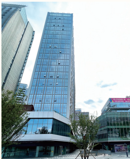
酒店及商業/寫字樓大樓