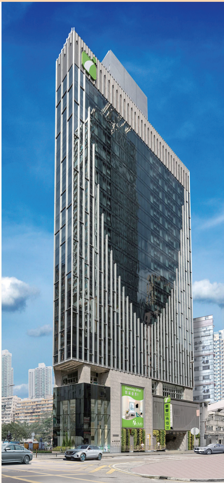
富薈旺角酒店 — 位於香港九龍旺角晏架街2號