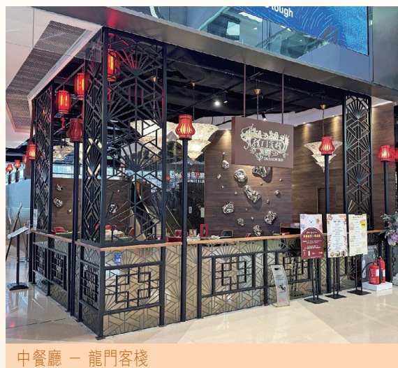
中餐廳 — 龍門客棧