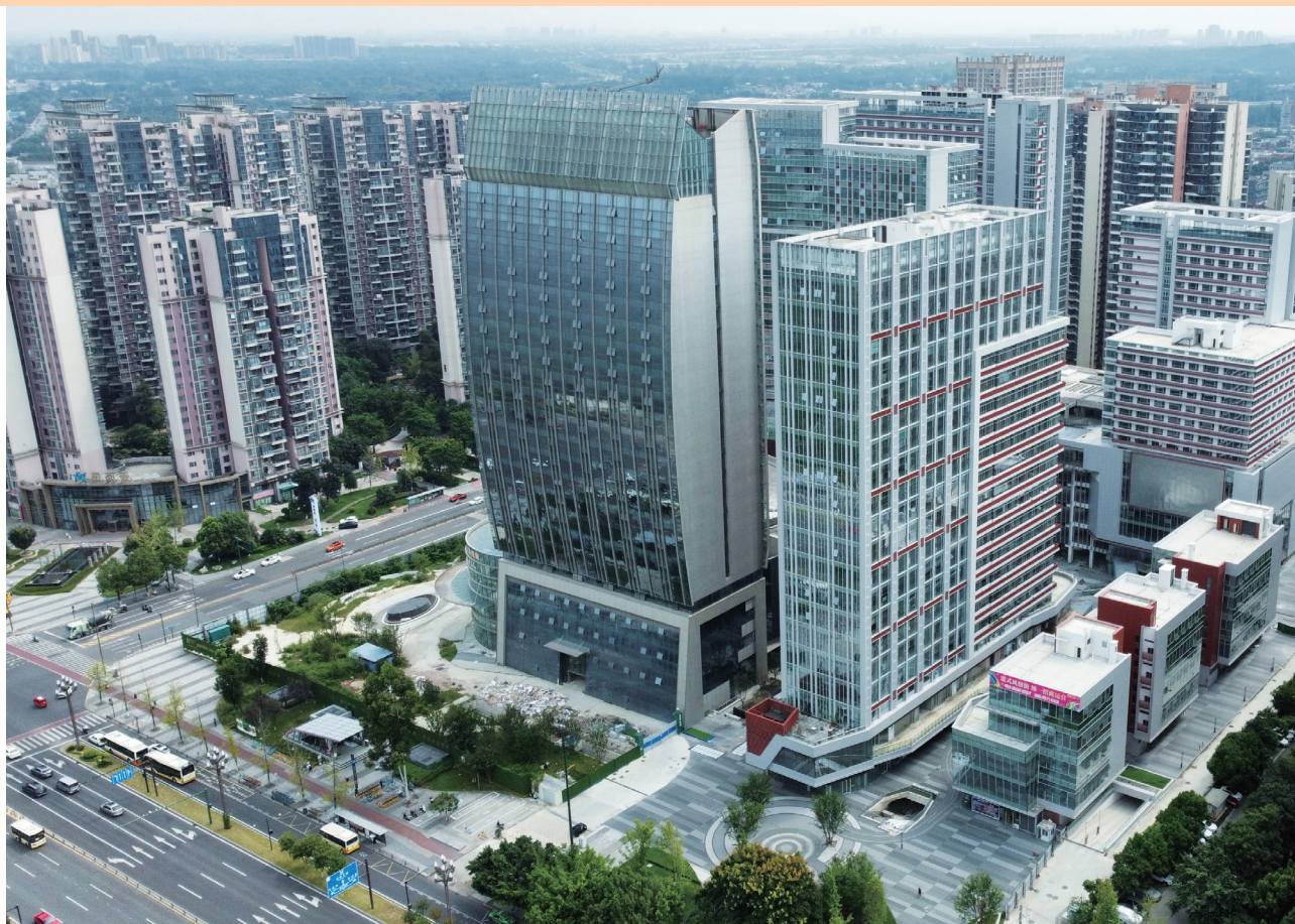
富豪國際新都薈 — 酒店及商業/寫字樓大樓