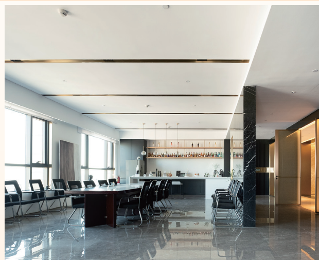
寫字樓大樓之多功能室