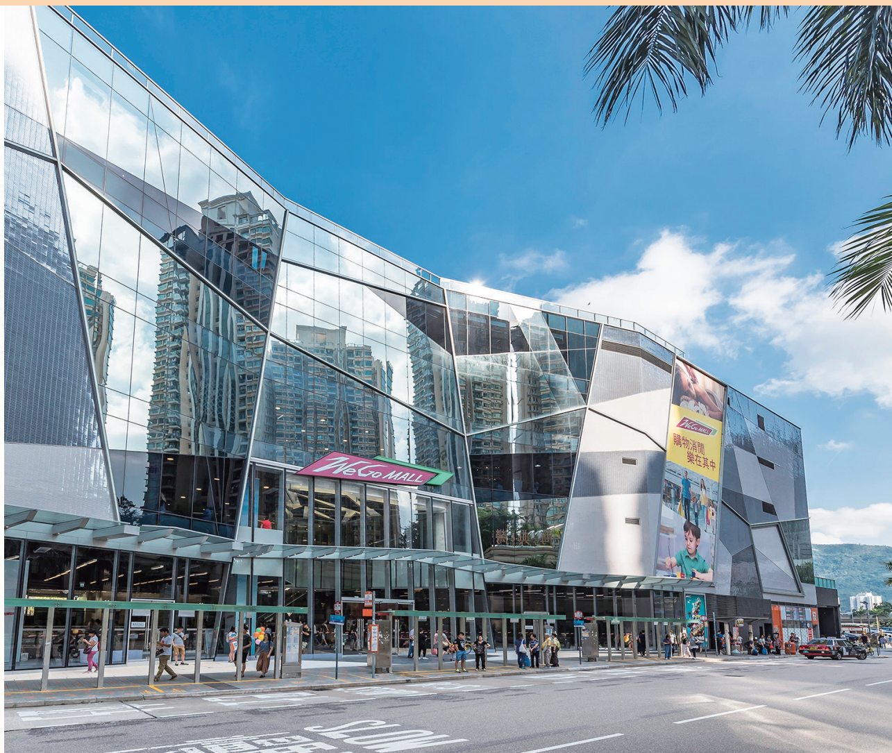
We Go MALL — 位於新界沙田馬鞍山保泰街16號之購物商場