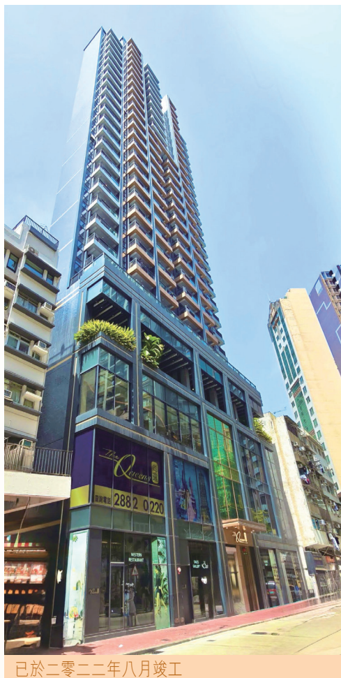
已於二零二二年八月竣工