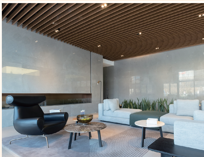
寫字樓大樓之大堂