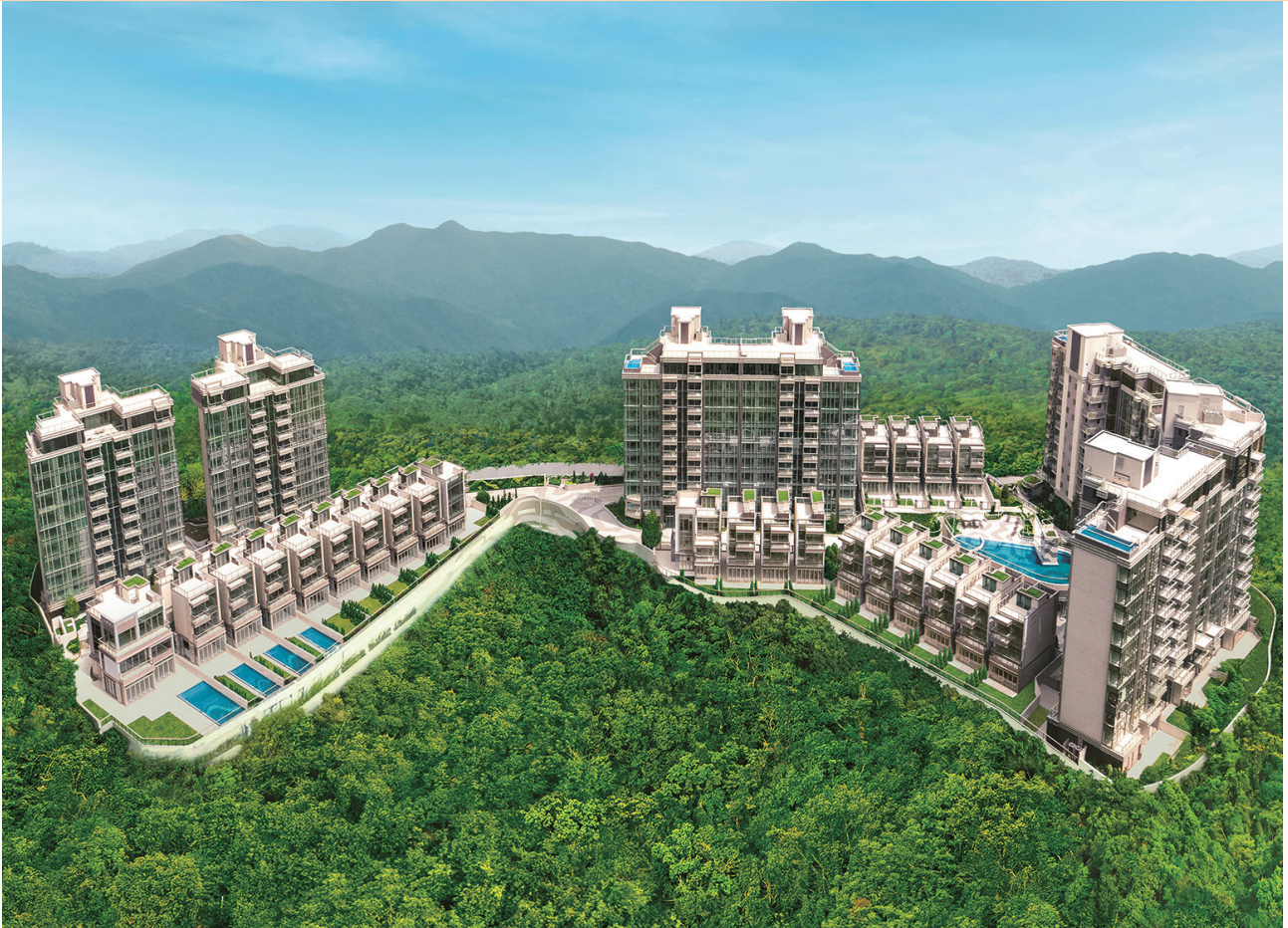
富豪 • 山峯 — 位於新界沙田九肚麗坪路23號之豪華住宅發展項目