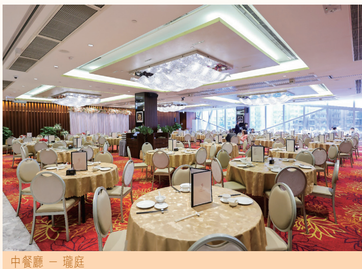
中餐廳 — 瓏庭