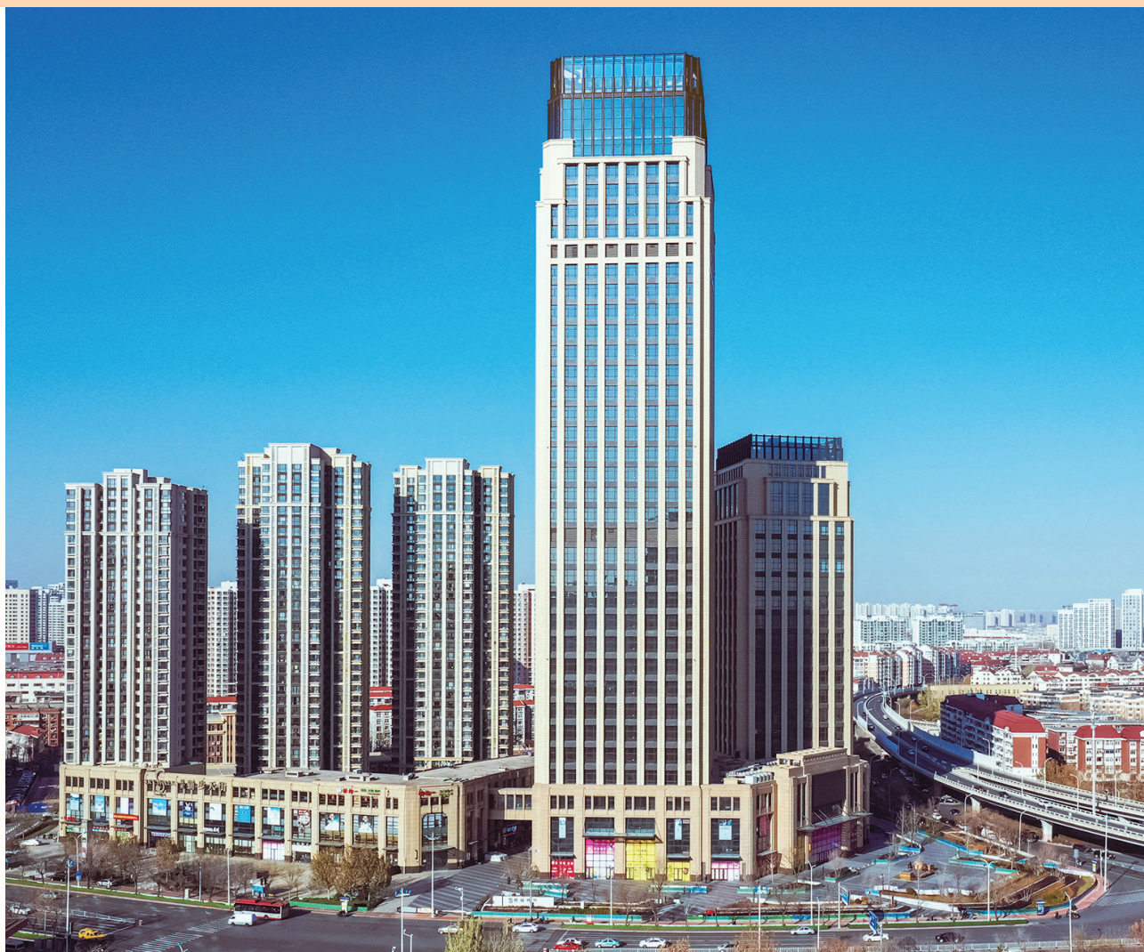
富豪新開門 – 位於天津河東區黃金地段之商業/寫字樓/住宅綜合發展項目