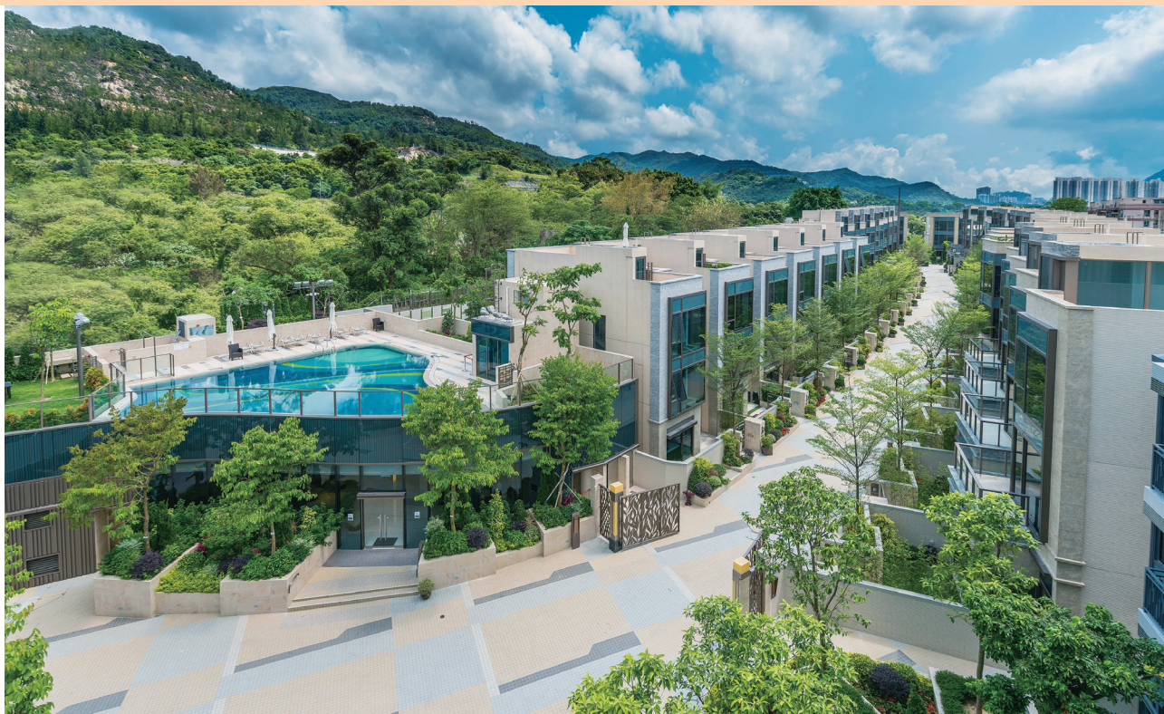
富豪 • 悅庭 — 位於新界元朗丹桂村路65至89號之住宅發展項目之花園洋房