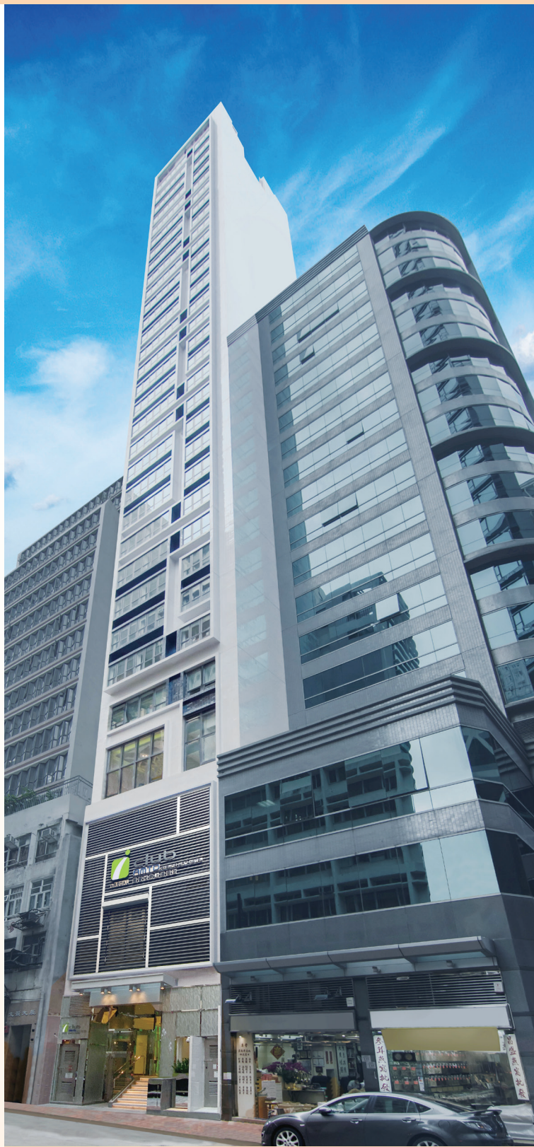
富薈尚乘上環酒店 — 位於香港上環文咸西街5號