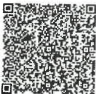
刘远帅年检二维码

本证书经检验合格, 继续有效一年。 This certificate is valid for another year after this renewal.