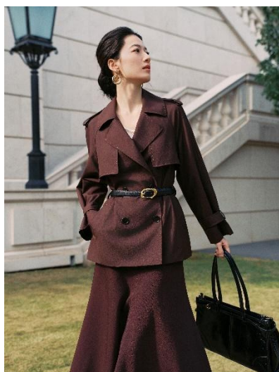
JZ 玖姿 品牌风格及店铺形象