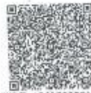
周雅琴年检二维码.png

本证书经检验合格，继续有效一年。 This certificate is valid for another year after this renewal.