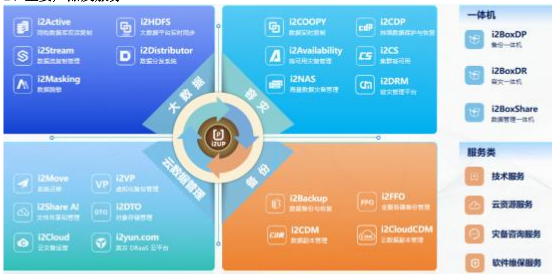
图 1 英方软件产品方案