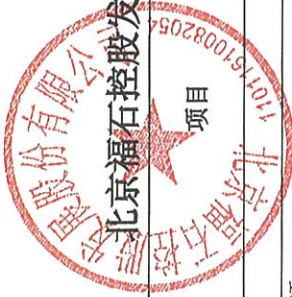
北京福石控股发展股份有限公司 2025 年度营业收入扣除情况表