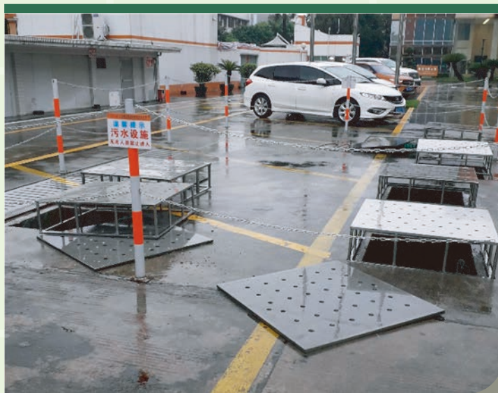
污水沉澱池(左)和污水設施(右)