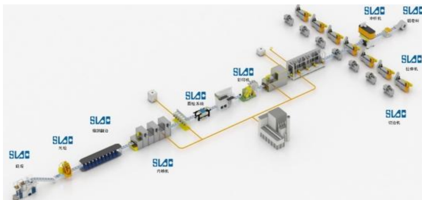
易拉罐高速生产线