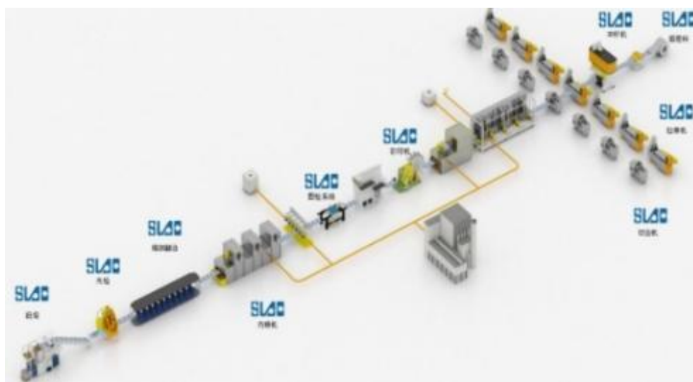
易拉罐高速生产线

高速易拉罐生产设备将铝材通过多次精密加工工艺生产出易拉罐产品。2015 年以来，公司凭借在易拉盖高速生产线积累的技术与客户优势，自主研发并实现易拉罐整线生产设备销售，打破了国外企业在此领域长期垄断的局面。为顺应国内外终端市场对易拉罐产品的消费需求，公司重点研发生产二片罐易拉罐整线设备。相较于传统的三片罐制品，二片罐制品具有密封性好、生产效率高、节省原材料等优势，但对于生产设备的技术要求也更高。目前，公司生产的高速易拉罐生产线的主要设备已开发成熟，达到了世界先进水平，可有效保证生产线的稳定性和良品率。