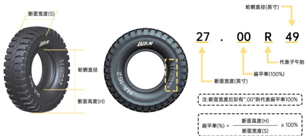
注：上图为 27.00R49 规格全钢巨胎参数解析。

公司自成立以来，始终专注于全钢巨胎领域，经过长期的技术沉淀，已成功研制并量产从 49 英寸到 63 英寸的全系列规格的全钢巨胎产品，包括 R49、R51、R57 和 R63 等全系列规格产品。全钢巨胎的规格参数根据轮胎扁平率的不同分为两种表现形式，具体如下：