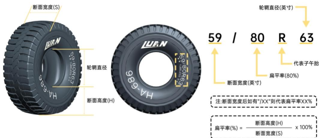
注：上图为 59/80R63 规格全钢巨胎参数解析。