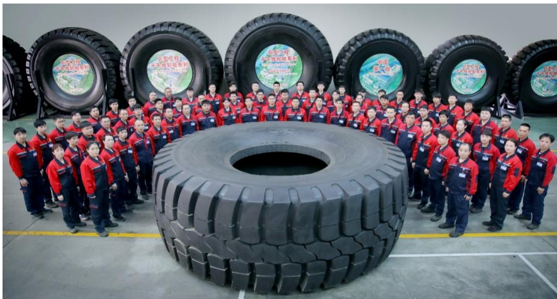
注：上图为公司员工与轮胎直径 63 英寸全钢巨胎合影。