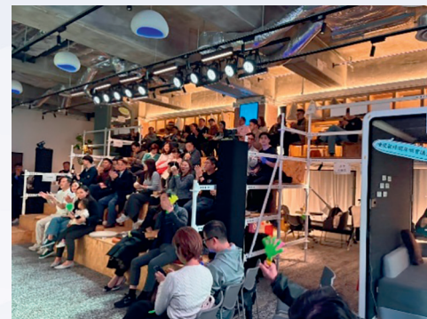
觀眾全情投入音樂會，氣氛熱烈。