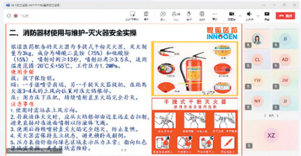
消防安全培訓 (消防器材使用與維護 - 滅火器與消火栓安全)