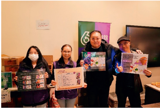
回收廚餘服務的職員(左一、二)、香港知名樂壇伯樂陳少寶先生(中)以及主辦方Riskory代表(右)大力支持回收廚餘。