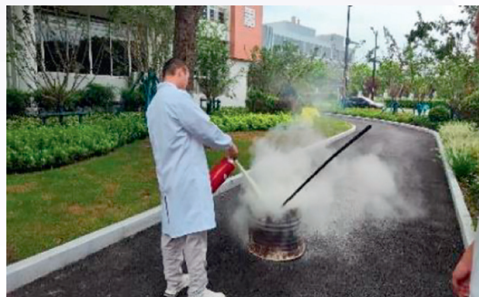
火災應急演練培訓