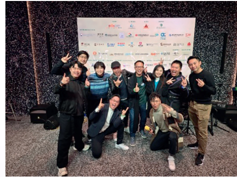
一眾香港本地歌手合照。