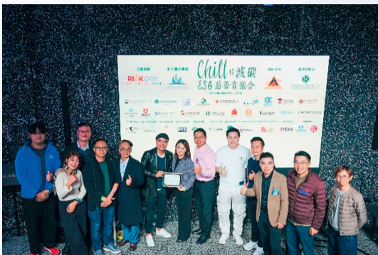
各綠色供應商及活動支持機構代表合照。