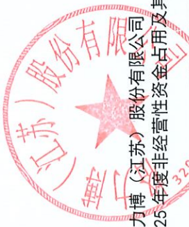
格力博(江苏)股份有限公司 2025年度非经营性资金占用及其他关联资金往来情况汇总表