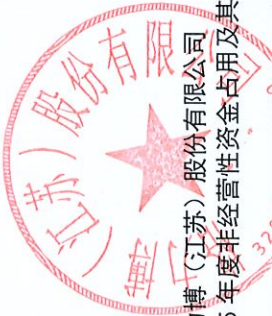
格力博(江苏)股份有限公司 2025年度非经营性资金占用及其他关联资金往来情况汇总表(续)