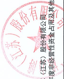
格力博（江苏）股份有限公司 2025 年度非经营性资金占用及其他关联资金往来情况汇总表（续）