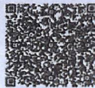
包梅庭年检二维码

本证书经检验合格,继续有效一年。 This certificate is valid for another year after this renewal.