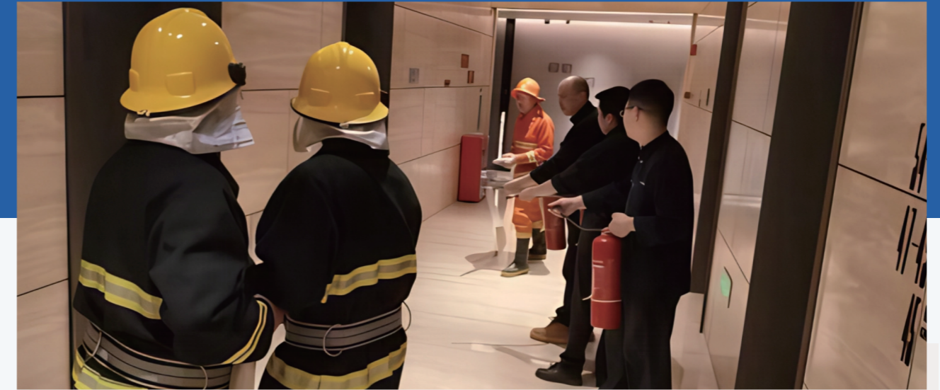
图：重庆保利中心消防演练现场

安全管理机制建设方面，公司持续强化顶层设计，修订完善《安全管理办法》，优化安委会组织架构与岗位职责，推动安全责任横向到边、纵向到底。依托安全巡检系统与机动沟通机制，实时掌握出资企业安全动态，实现风险早发现、早处置。全年累计开展安全自查1870次，排查并完成安全隐患整改，形成全流程闭环管理。