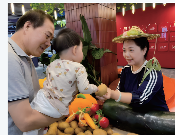
图：民生百货丰收节活动现场

2025年丰收节期间，民生百货创新打造“丰收硕果”主题活动，以五谷丰登、瓜果飘香的视觉场景传递丰收文化符号；同步联动非遗市集，引入剪纸、泥塑、草编等非遗摊位，打造“丰收+非遗”特色展区，让传统农耕文明与非遗技艺同台亮相，并通过店内媒介与官方社交平台同步传播，使助农活动成为传承传统文化的重要载体。