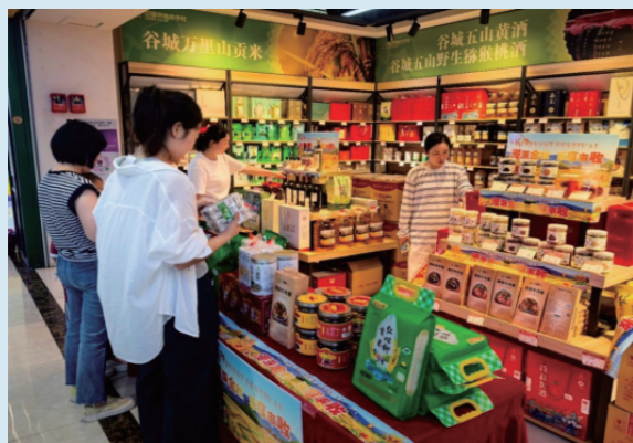
图：谷城星悦茂助农活动现场

顺客隆推出惠农主题活动，集中展销水果、有机大米等优质农产品，联动儿童康复中心开展“瓜果大探秘”互动活动，在丰富儿童农耕认知、拉近社区与农户距离的同时，单场吸引客流近50万人次，线上还联合抖音直播推出农产品折扣券，整体带动农产品销售超130万元，实现线上线下联动助农。