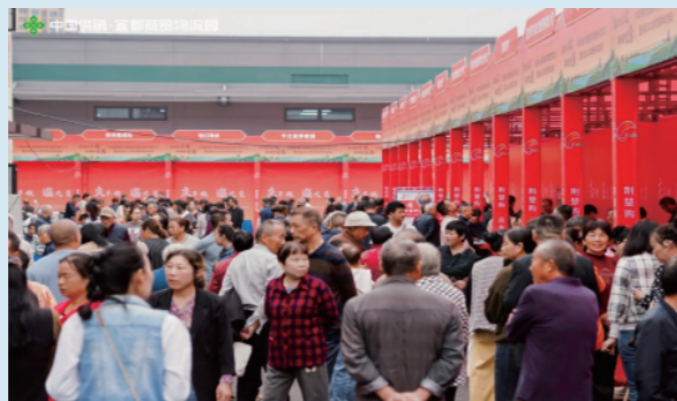
图：宜都商贸物流园助农活动现场

④ 供销大集立足乡村文化传播，将“丰收文化+非遗技艺”深度融合，让助农行动更具温度与内涵。