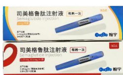
司美格鲁肽注射液