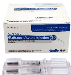
醋酸格拉替雷注射液