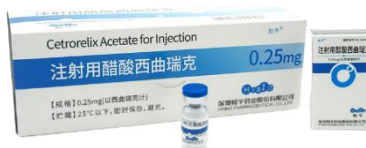
注射用醋酸西曲瑞克