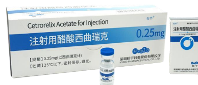
注射用醋酸西曲瑞克