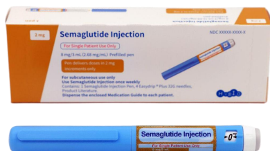
司美格鲁肽注射液