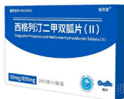
西格列汀二甲双胍片(II)