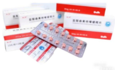
盐酸曲美他嗪缓释片