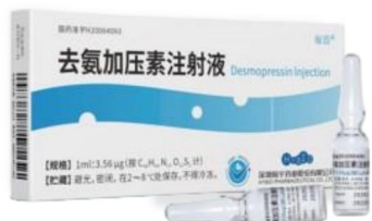
去氨加压素注射液