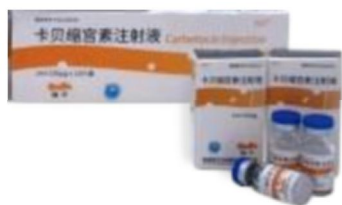
卡贝缩宫素注射液