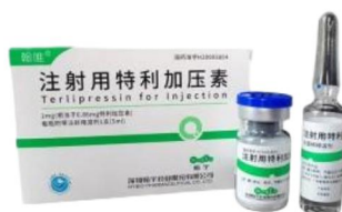
注射用特利加压素