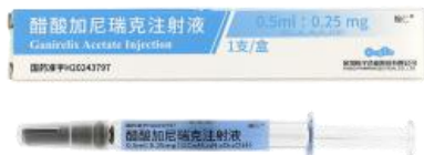
醋酸加尼瑞克注射液