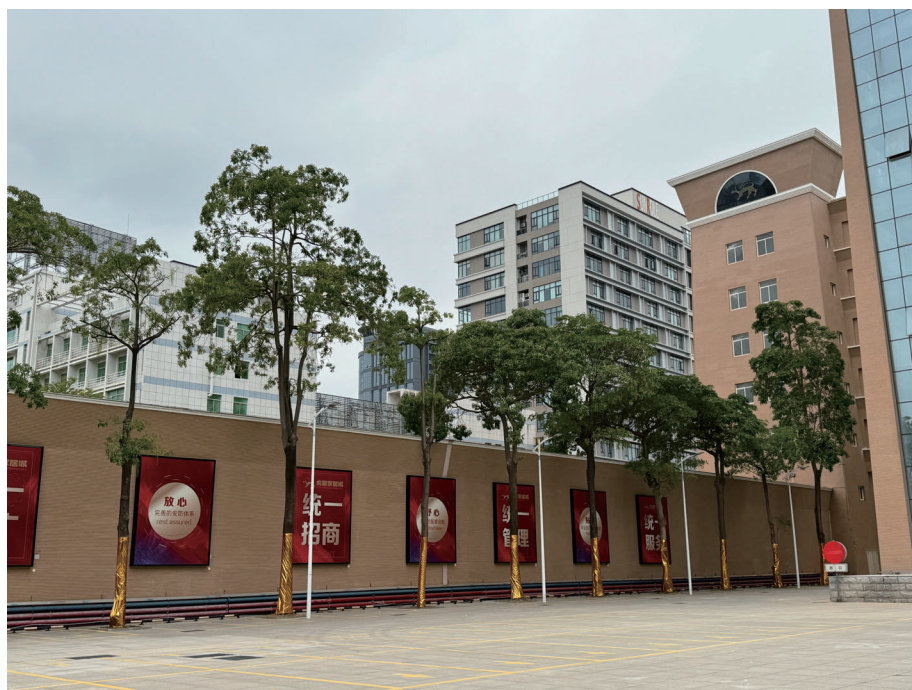
虎都實業公司環境