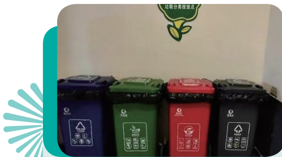
本集團辦公室內的生活垃圾分類回收箱