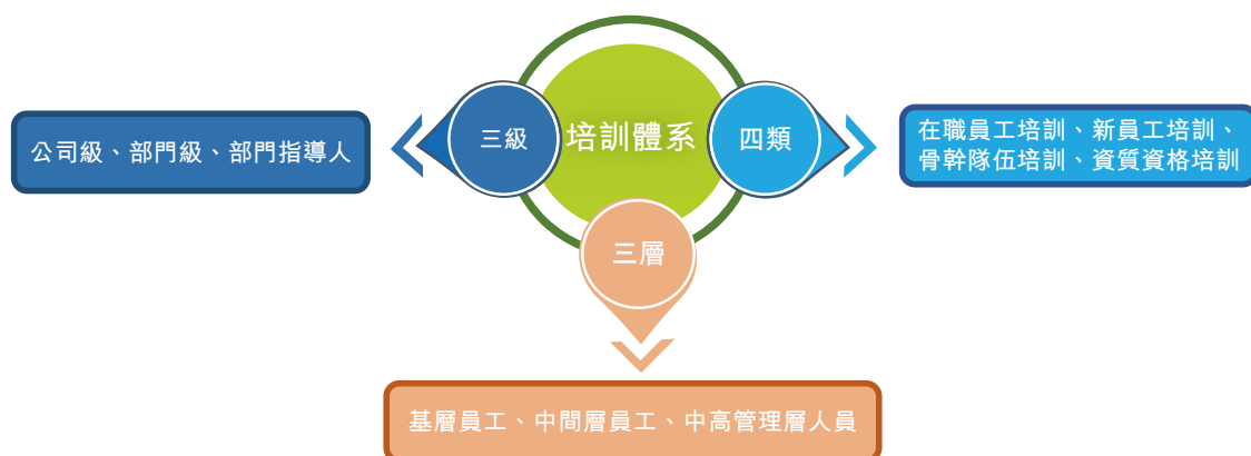
集團人才培訓體系

本集團制定實施《培訓管理制度》，構建了「三級」「四類」「三層」的培訓體系，培訓內容針對性覆蓋企業管理、領導力、資質認證、技能培訓、企業文化等內容，完善員工知識體系和技能水平，突出關鍵人才培養，為集團經營改善奠定了堅實基礎。此外，《培訓管理制度》還規定了培訓機制、培訓信息反饋內容，以保障培訓效果，不斷提升改進員工培訓工作。