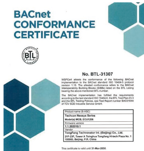
BTL(BACnet Testing Laboratories)認證證書