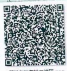
姜纯友的年检二维码.png

本证书经检验合格，继续有效一年。 This certificate is valid for another year after