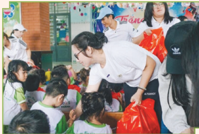
■ 為幼稚園提供慈善支援