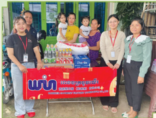
■ 為身處困境的家庭提供資源援助

於報告期內，我們在生產設施所在地區為身處困境中的兒童及其家庭提供援助。我們的行動不僅着眼於解決當務之急，更致力於透過創造更光明未來的機會，賦予該等社區自力發展的能力。憑藉我們的貢獻，我們矢志培育在困境中的兒童與家庭的抗逆能力，提升其福祉水平，從而深化對社會責任與社區參與的承諾。