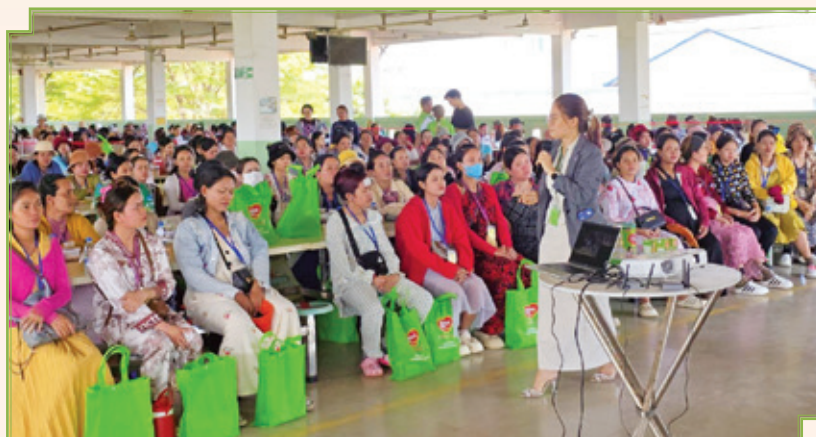
■ 懷孕僱員健康講座

我們特別致力於保障生產營運中女性工人的權益。我們的政策明確禁止要求女性求職者於招聘過程中接受懷孕檢測或提供不懷孕保證。懷孕僱員及育有12個月以下嬰兒的母親享有縮短工時以及於產假期間享有全薪及工作保障。此外，我們為懷孕僱員提供健康講座，並於復職時安排職前培訓，協助順利重返職場。