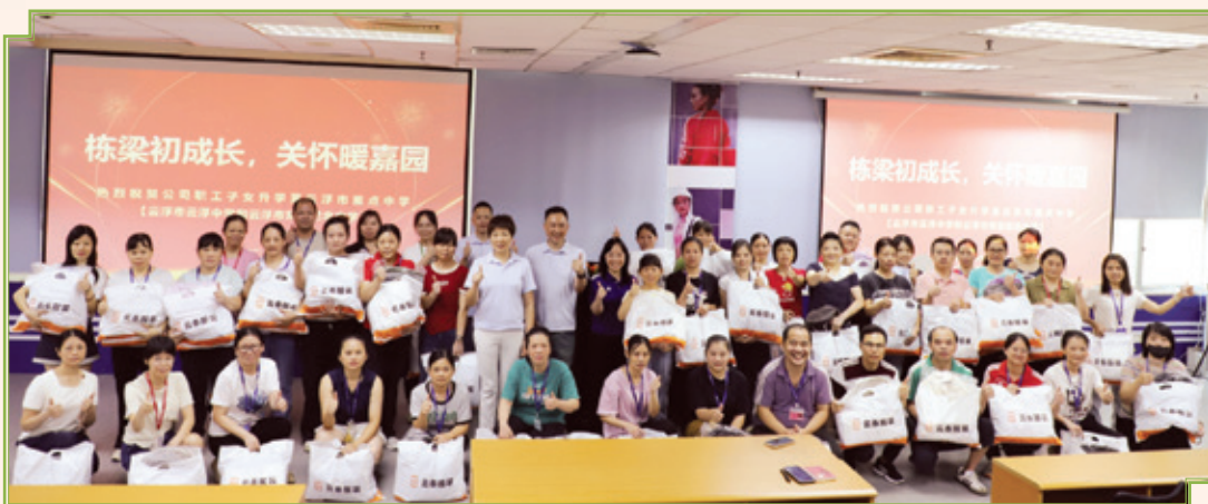
■ 僱員子女升學慶祝會