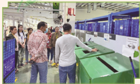
■ 廢棄物分類及資源節約培訓