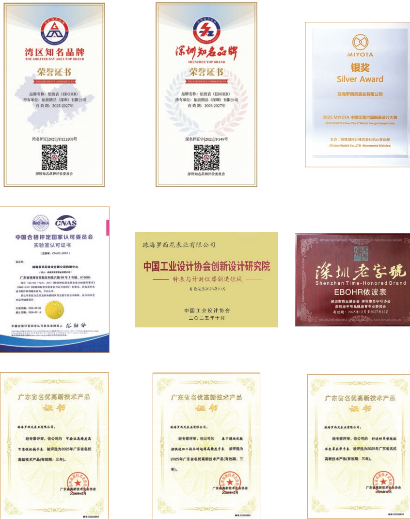
羅西尼的產品質量獲得了不同機構的認可