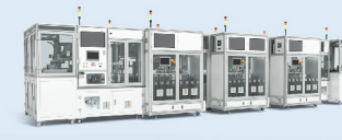
BMS电池管理芯片自动化检测设备