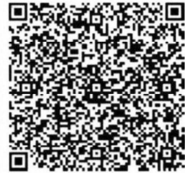
张杭的年检二维码