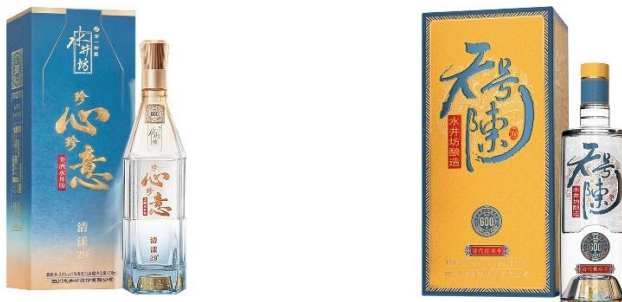
水井坊·珍心珍意·清漾29°