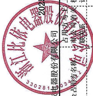
附表：2025年度非经营性资金占用及其他关联资金往来情况汇总表