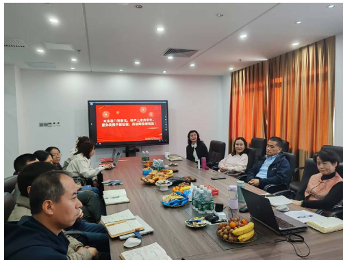
員工生日會及座談會

本年度公司透過發放生日福利與舉辦里程碑慶祝活動，以肯定員工成就，進而有效增強同仁對企業的凝聚力與團隊團結力。