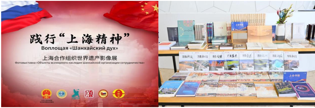
上海合作组织文化交流项目

报告期内，青岛出版社连续 12 年入选“中国图书海外馆藏影响力出版 100 强”，跻身榜单前十、数字出版排名第三；《超厉害的中国交通工程（阿拉伯文）》《中华优秀传统文化少儿绘本大系·古代丝绸之路（马来文）》入选丝路书香工程，《喜鹊窝（德文版）》获年度输出版优秀图书奖；《中医是什么》《唐风流韵》等 18 种图书版权输出至埃及、蒙古等国家；《汉字千年》数字化国际巡展项目获评商务部等六部委“千帆出海”重点活动；持续放大青岛上合组织旅游和文化之都的地缘优势，“上合书架”项目在俄罗斯等 4 国落地，“上合组织国家出版产业大会”“上合组织世界遗产影像展”“上合书架”3 项工作列入中国担任上海合作组织 2024—2025 年轮值主席国工作成果清单，公司逐步形成了版权输出、文化交流、数字场景多元融合的海出矩阵。