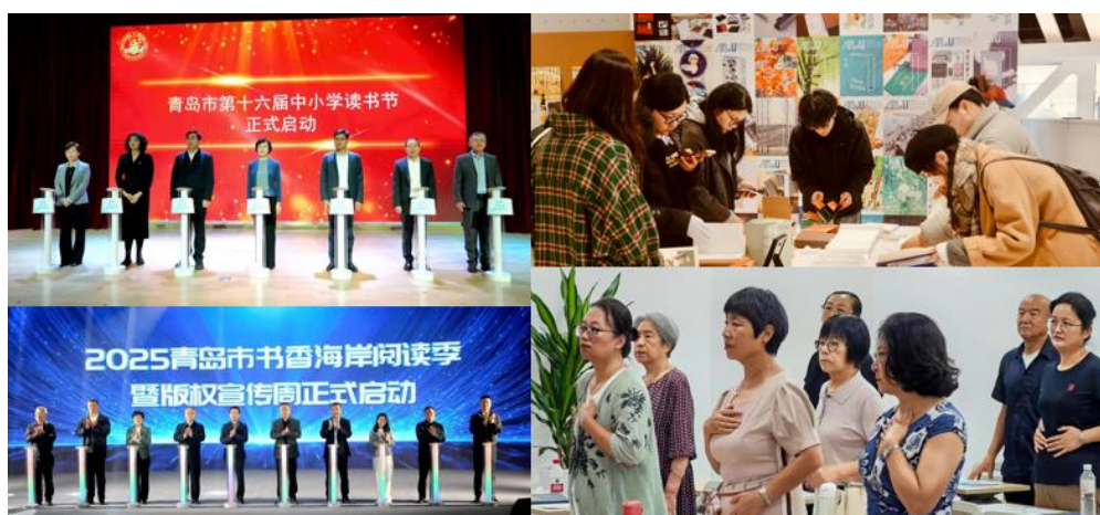
持续推动全民阅读，助力“书香青岛”建设

公司深入贯彻落实习近平总书记关于推动全民阅读、建设书香社会的重要指示要求，为培育青少年终身阅读习惯、服务书香社会建设提供专业支撑。