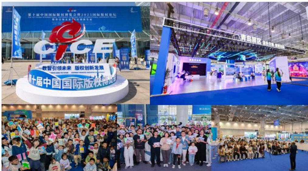
2025 年公司参与组织举办第十届中国国际版权博览会

公司主动融入国家战略和省市发展大局，在主题出版、重大项目、文化出海等方面持续发力，积极践行新时代的文化使命。参与组织举办第十届中国国际版权博览会，展会规格为历届之最、数智主题鲜明、活动丰富多样、成效扎实突出，充分展示我国版权领域数智化新成果、版权赋能产业发展新实践。