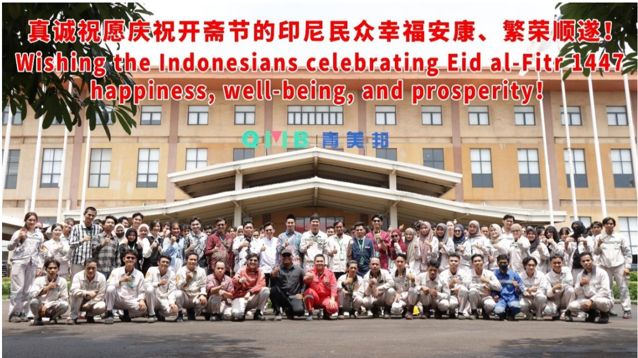
图 6 QMB 举行开斋节系列祈福活动