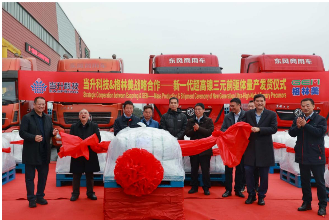
图 2 当升科技&格林美战略合作——新一代超高镍三元前驱体量产发货仪式

2026 年 2 月 28 日，北京当升材料科技股份有限公司（以下简称“当升科技”）与公司在格林美（荆门）园区共同举行新一代超高镍三元前驱体量产发货仪式，承载着双方技术结晶的高性能材料正式启运，标志着格林美新一代超高镍产品实现规模化量产发货，也标志着双方在高端前驱体领域的合作迈入新阶段。