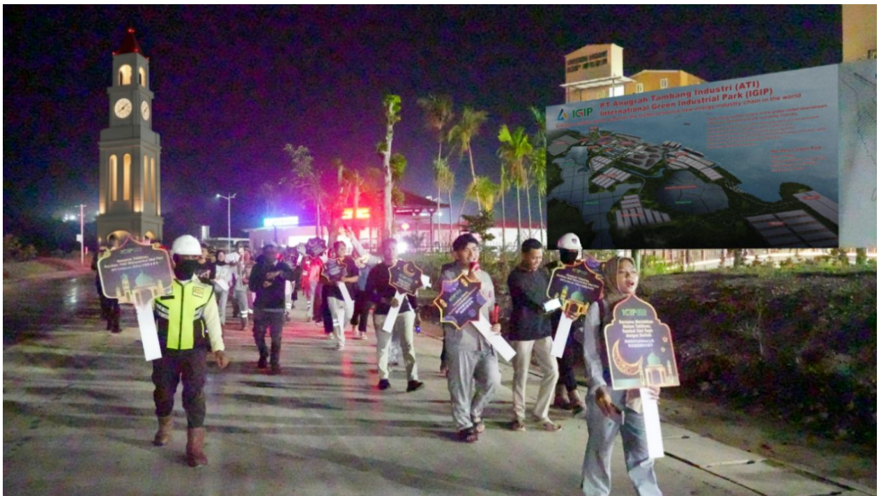
图 7 IGIP 举行开斋节系列祈福活动