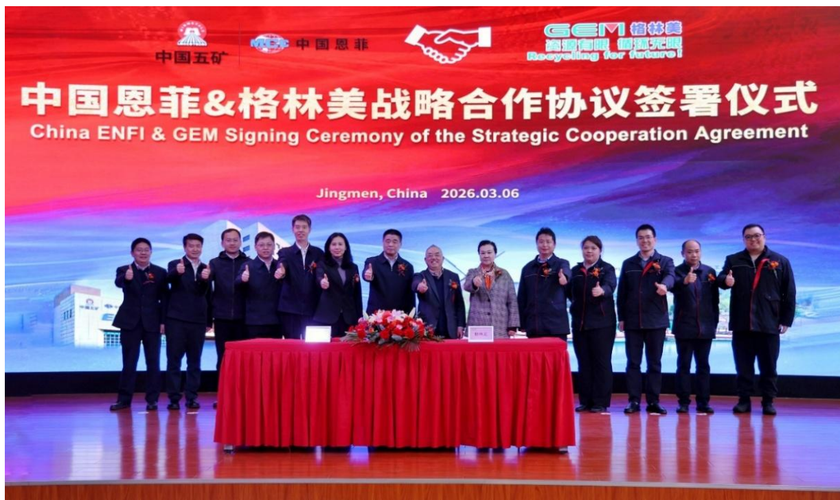
图 3 中国恩菲&格林美战略合作协议签署仪式

2026 年第一季度，公司与中国恩菲工程技术有限公司（以下简称“中国恩菲”）签署了战略合作协议，中国恩菲凭借深厚的资源整合能力、成熟的海外工程经验与强大的项目实施能力，公司依托高效的市场化运营机制、持续的技术创新活力与全球循环经济产业优势，双方组合优势、强强联合，打造全球竞争力的工程技术联盟力量，极大提升公司海外镍资源项目工程设计能力与各种要素资源配置能力，保障公司海外镍资源项目建设的成功性与经营运行的稳定性，促进公司海外项目建设与经营达到预期目标。