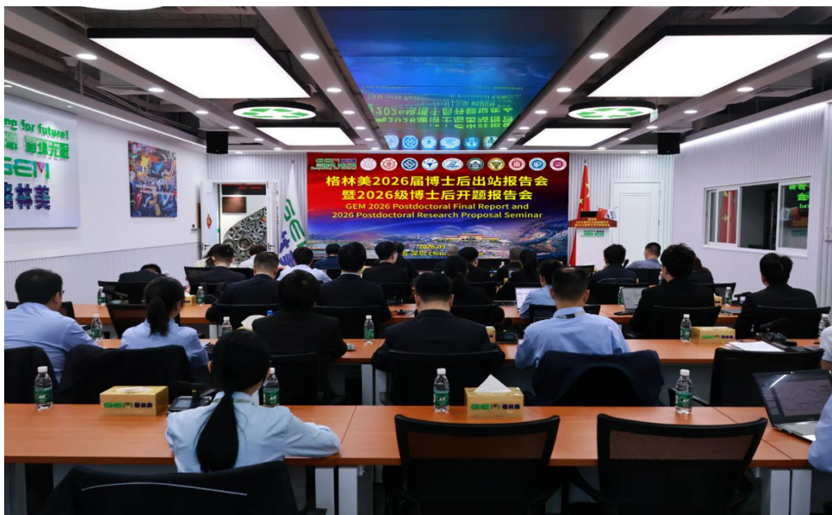
图 5 格林美 2026 届博士后出站报告会暨 2026 级博士后开题报告会