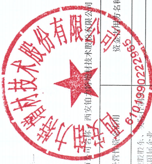
2025年度非经营性资金占用及其他关联资金往来情况汇总表