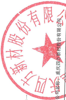
2025年度非经营性资金占用及其他关联资金往来情况汇总表