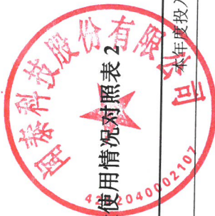
2025年度募集资金使用情况对照表 2