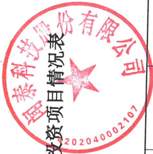
2025 年度变更募集资金投资项目情况表