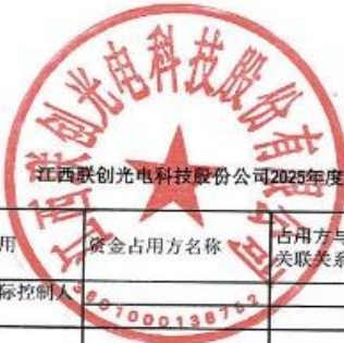
附件：江西联创光电科技股份有限公司2025年度非经营性资金占用及其他关联资金往来情况汇总表