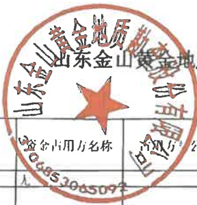
山东金山黄金地质勘查股份有限公司 2025年度非经营性资金占用及其他关联资金往来情况汇总表