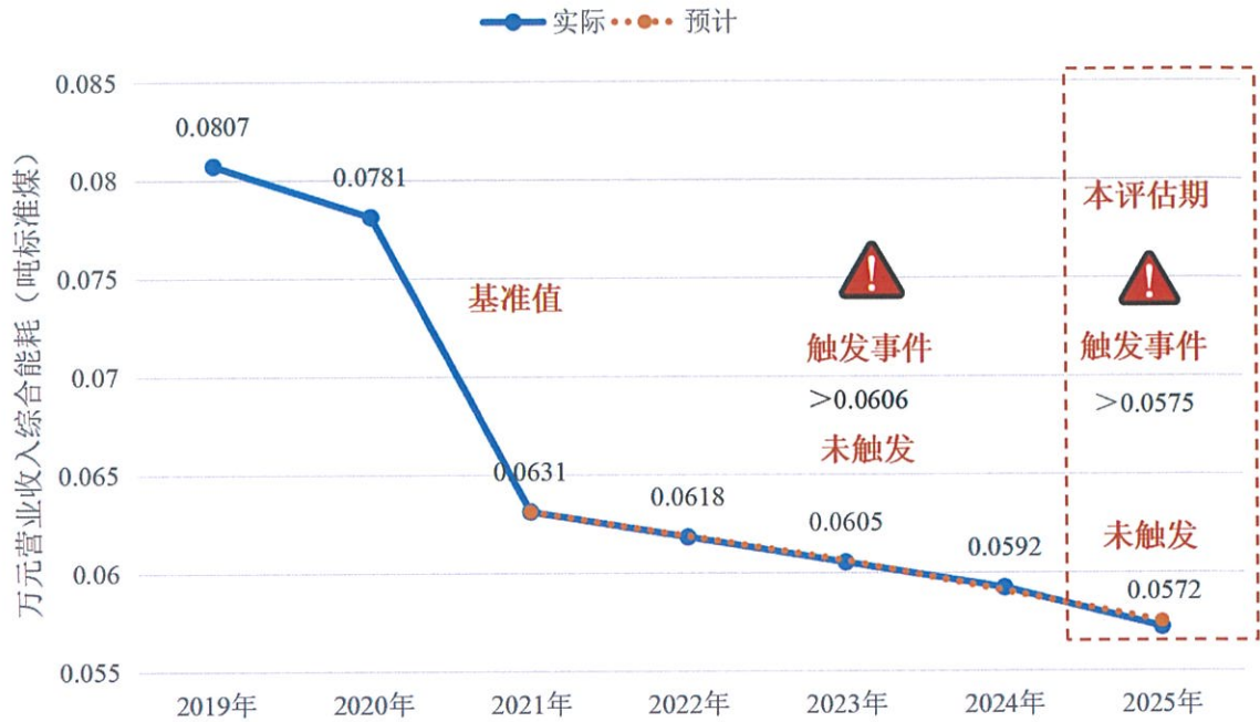
图 1 中国铁建可持续发展绩效目标（SPT）的实现进展情况

本期债券第一个触发年度（2023 年）的可持续发展绩效目标实现的绩效结果已满足可持续发展绩效目标要求。