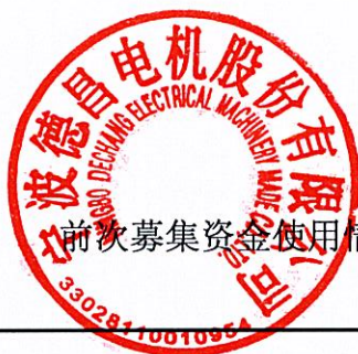
前次募集资金使用情况对照表