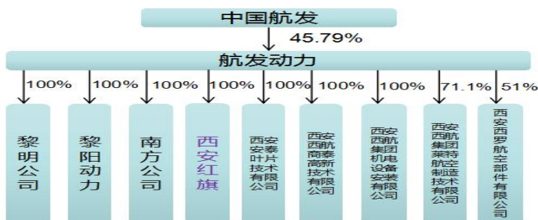
图 1: 资产划转前股权结构