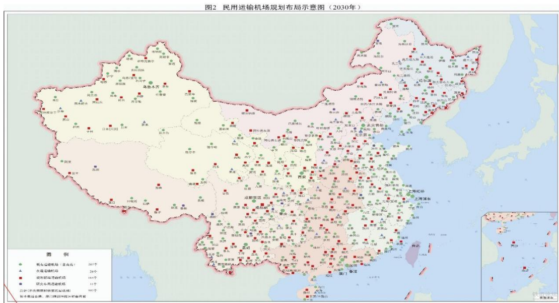
图 5-4：全国民用机场布局分布图（2030 年）