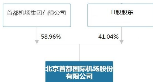
图 5-1：截至 2026 年 3 月 31 日发行人股权结构图

北京首都国际机场股份有限公司的控股股东为首都机场集团有限公司。首都机场集团有限公司隶属于民航局。