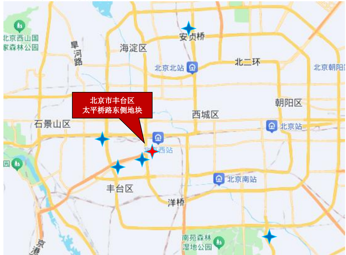
图 1：北京市丰台区太平桥路东侧地块